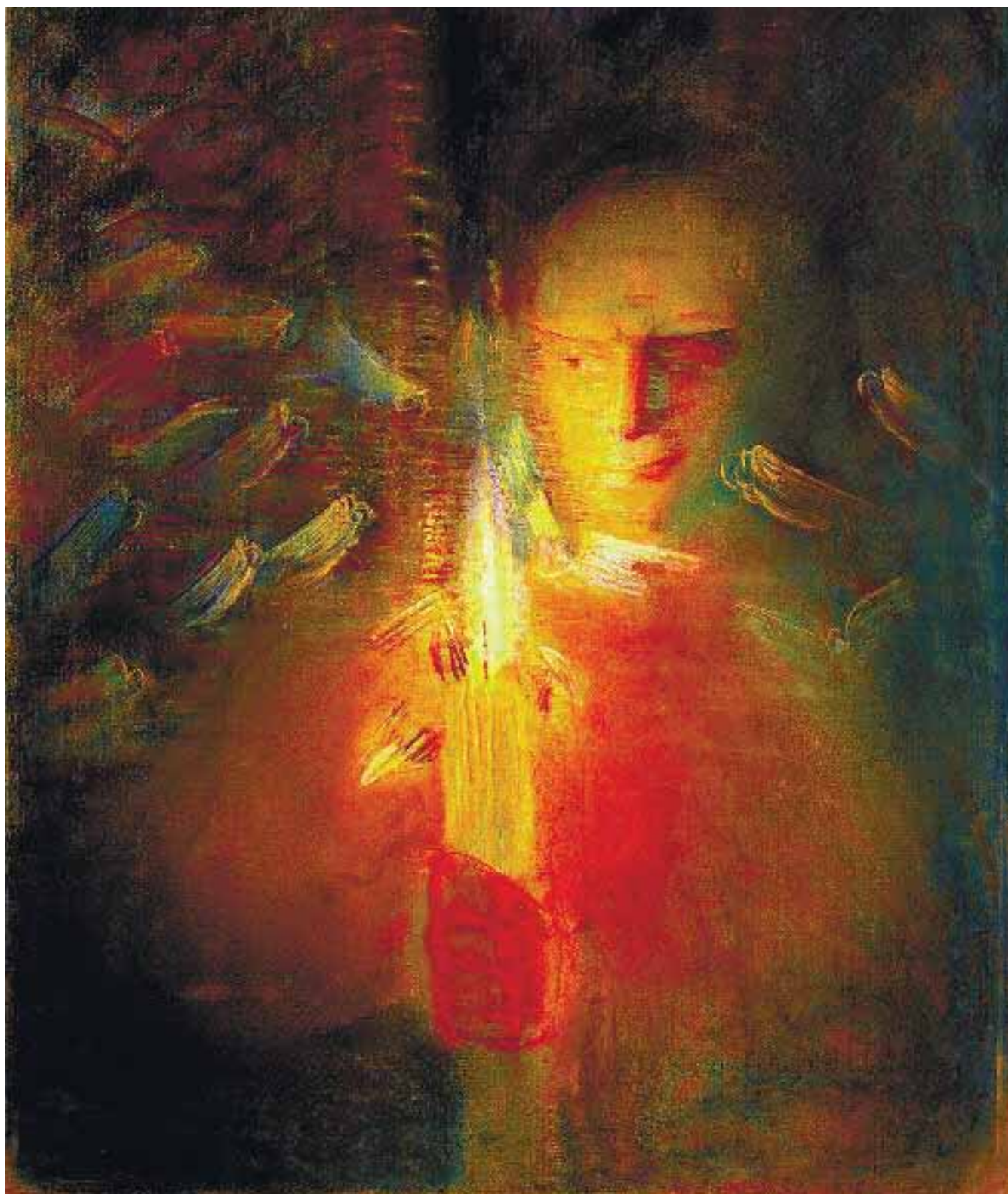
Николай Чюрлёнис. Правда. 1909

Человек в его современной форме требует жестких внешних рамок для своей «выделки». В этом заключен еще один парадокс социогуманитарного уклада – воспитание людей с пробужденной волей требует суровой внутренней дисциплины.