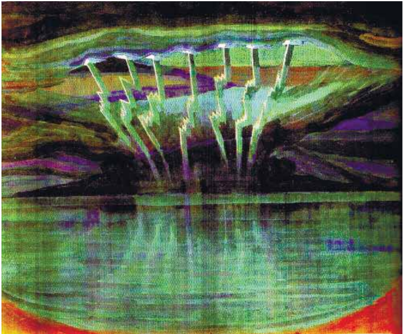
Николай Чюрлёнис. Молния. 1909

рению не только новых форм в рамках существующих культурных нормативов, но и самих нормативов, что представляется шагом гораздо более радикальным, чем предшествовавшие этому попытки.