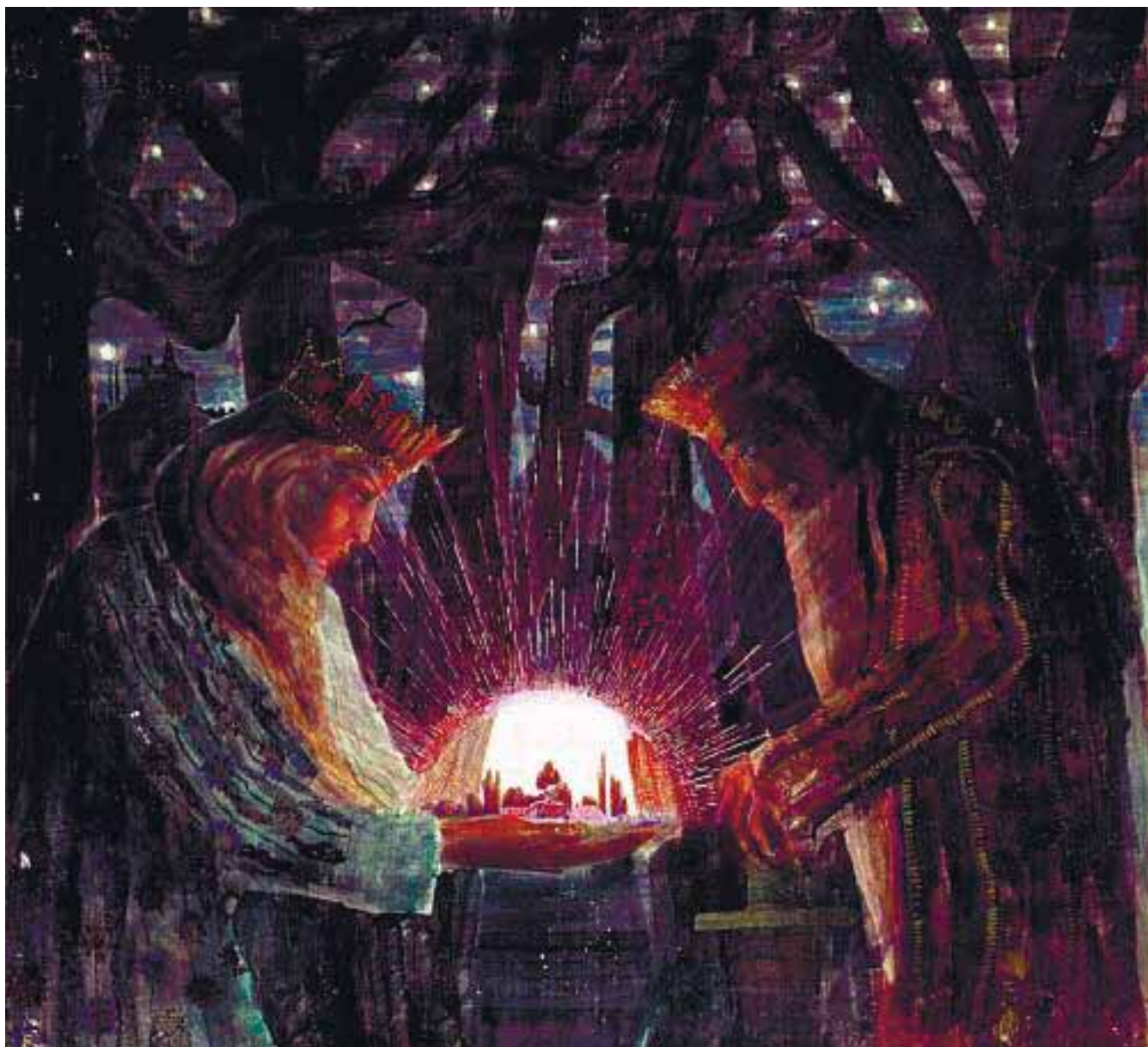
Николай Чюрлёнис. Сказка (Сказка королей). 1909