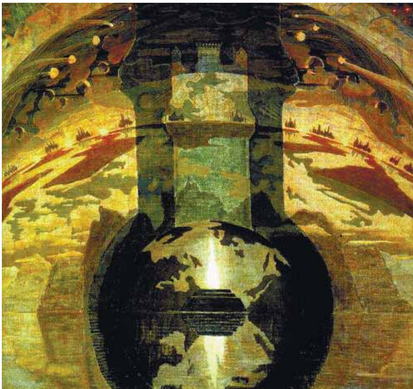
Николай Чюрлёнис. Рех. 1909

Управляющая элита социогуманитарного уклада и особенно периода его формирования должна научиться вовремя артикулировать новые идеологемы, превращать катастрофический фактор изменения идеологического вектора в фактор интенсивного развития. Быть не рабами идеологем, а их создателями и господами.