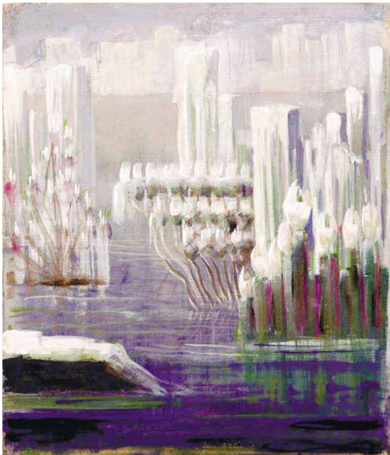
Николай Чюрлёнис. Сотворение мира (VI), 1905

ния и обеспечения функционирования СГУ-сообществ. И такие технологии существуют уже сейчас.