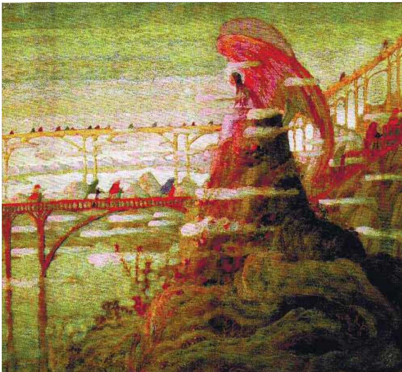
Николай Чюрлёнис. Ангел. 1909

тивности смещается от внешней (социальной, культурной, силовой) стимуляции внутрь сознания, к его активным, волевым, творческим слоям.