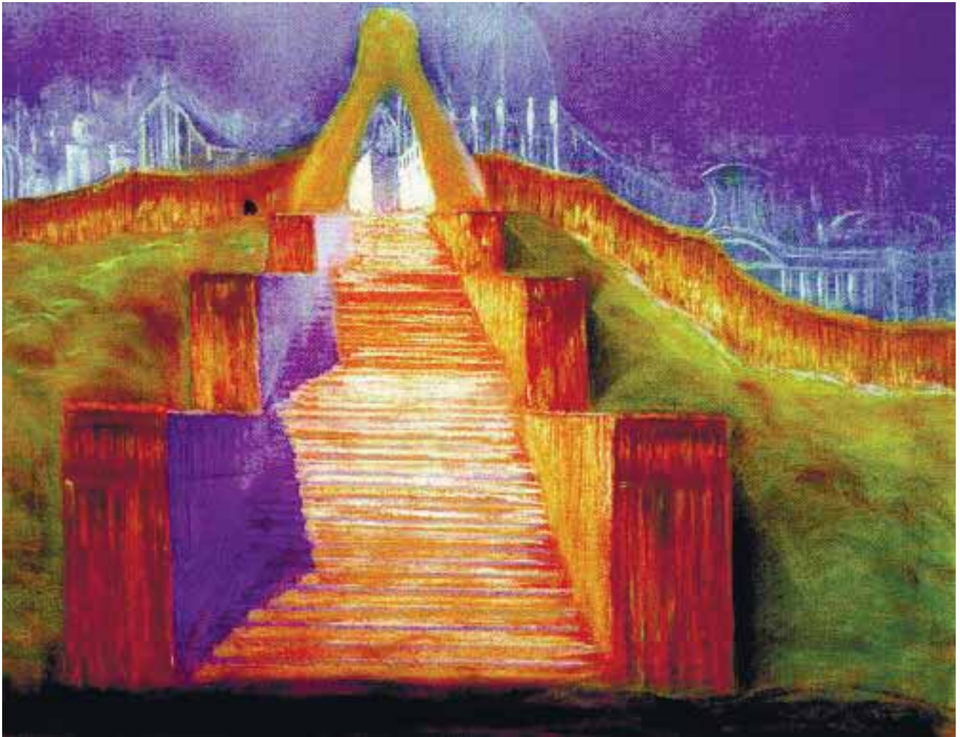
Николай Чюрлёнис. Потоп. 1904

стемы, определяющей функционалы и численность работников. Социальная структура проектируется в той же логике, что и любая другая машина: система ролей, функций, штатное расписание. Это предопределяет возможности организации. Если акцент делается на системе мест и ролей, то вводятся усредненные нормативные требования к тем, которые эти места заполняют. Организованные структуры такого типа способны себя воспроизводить и достраивать по заранее заданному плану, но переход на новую траекторию развития сопровождается ломкой предыдущей структуры и повторением цикла: система мест – роли – нормативы. В СГУ-организациях иной принцип устройства. Определяется колеблющаяся по численности группа людей, про-